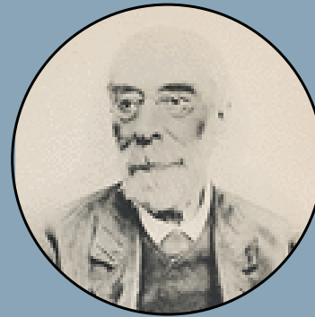
Charles Renouvier (1815-1903) est un philosophe.